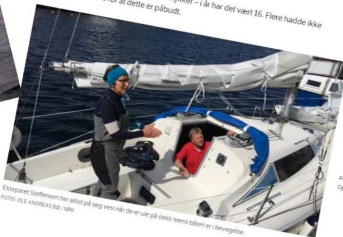
Ekteparet Steffensen har alltid på seg vest når de er ute på dekk mens båten er i bevegelse.

I første halvår i fjor døde 10 i fritidsbåtulykker – i år har det vært 16. Flere hadde ikke vest på seg, til tross for at dette er påbudt.