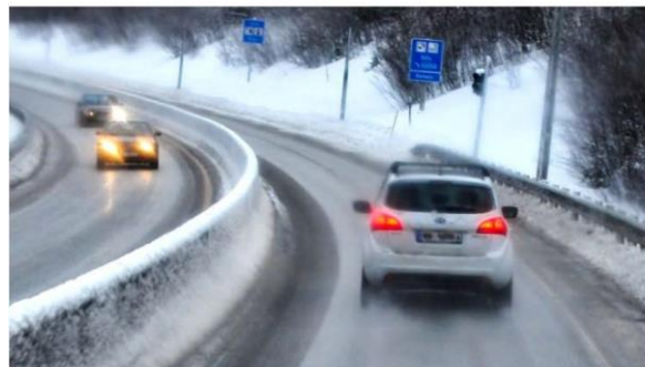
TRAFIKKSIKKERHET: 107 mennesker mistet livet i trafikken i 2017. Veier som er metefrie er viktige for å få ned tallet på dødsulykker.

107 mennesker omkom i trafikken i 2017. Det er det laveste tallet siden 1947, og det til tross for at trafikken er mangedoblet siden den gang.