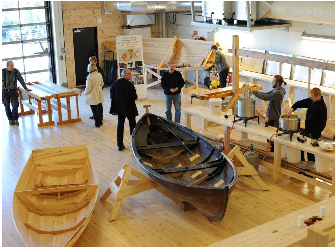
Båtbyggerlinje – Kompositt og Trebåt Plus Skolen i Fredrikstad