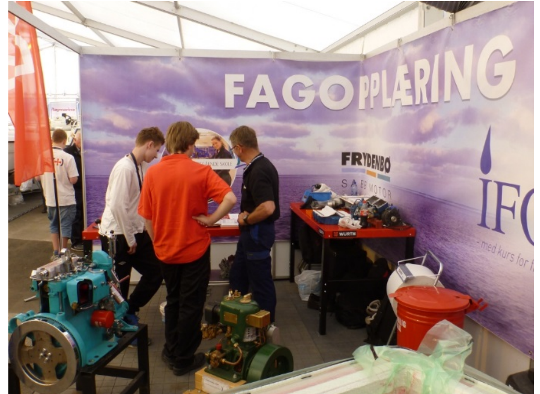
2004 - 2018 Ca. 160 lærlingkontrakter i Norge